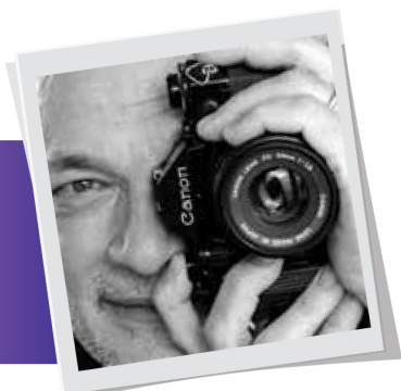
piše: Zoran Lešić