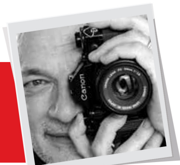
piše: Zoran Lešić foto: Erwin Olaf