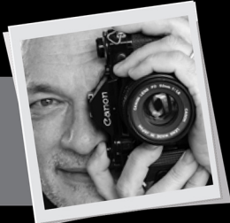
piše: Zoran Lešić